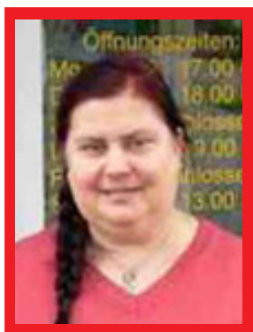
Qualitätsmanagement- beauftragte, DIE LINKE